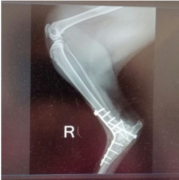
Schnuckis Gelenk wurde gerichtet