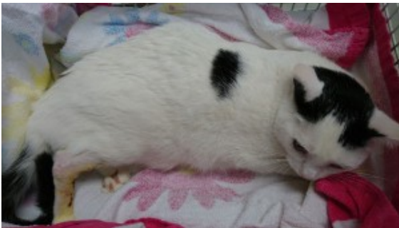
Schnucki nach der OP

Katze Schnucki hatte leider nicht so einen guten Start ins Leben. Sie wurde in einem verwahrlosten Messi-Haushalt geboren. Niemand kümmerte sich so richtig um den Nachwuchs, und Schnucki entwischte dem Besitzer aus der Wohnung. Eine aufmerksame Nachbarin fütterte die scheue Katze und beobachtete eine seltsame Beinstellung bei Schnucki. Da Schnucki aber sehr misstrauisch war, bat die Frau den Katzenschutz Bonn/Rhein-Sieg e. V. um Hilfe. Wir haben nacheinander alle sechs Katzen inklusive Schnucki rausgeholt. Schnuckis Fehlstellung am Hinterbein entpuppte sich als ein alter Bruch. Sie konnte das Bein nicht richtig belasten, denn es knickte im Sprunggelenk weg. Schnucki wurde geröntgt, und wir standen vor der Alternative, das Bein abnehmen oder sie operieren zu lassen. Da sie noch eine junge Katze ist, haben wir uns für die Operation entschieden. Diese ist gut verlaufen. Schnucki muss noch ein paar Wochen in einer Box ausharren und kann dann endlich die Sonnenseite des Lebens ohne Einschränkungen genießen. Die Behandlungskosten belaufen sich auf ca. 1.500 € und reißen ein großes Loch in unsere