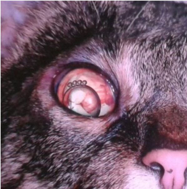
■ Das Auge nach der Operation