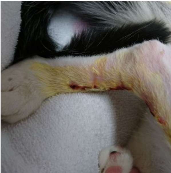
■ Schnuckis Fuß nach der OP