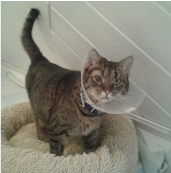
■ "Durch Deine Spende kann ich wieder sehen!"