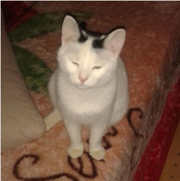
■ Schnucki dankt für Ihre Spende