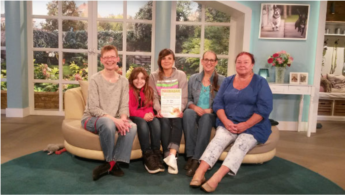
Die Kandidaten unserer Sendung: