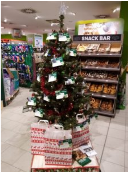
Fressnapf Bad Honnef