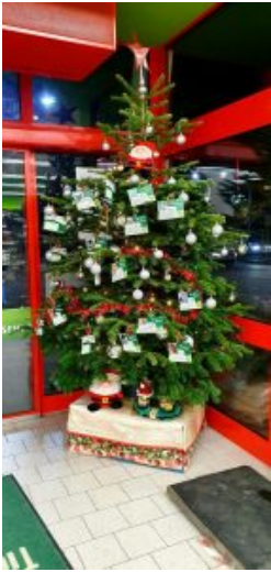
Fressnapf Bonn - Buschdorf