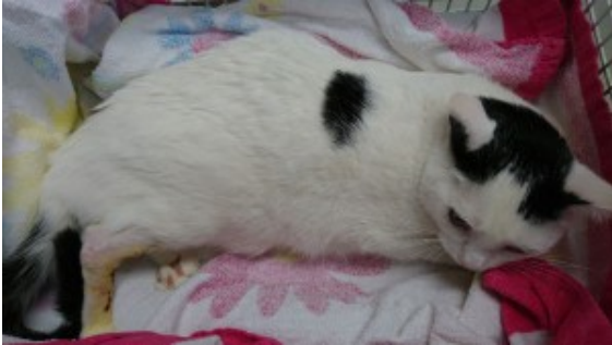
Schnucki nach der OP

Katze Schnucki hatte leider nicht so einen guten Start ins Leben. Sie wurde in einem verwahrlosten Messi-Haushalt geboren. Niemand kümmerte sich so richtig um den Nachwuchs, und Schnucki entwischte dem Besitzer aus der Wohnung. Eine aufmerksame Nachbarin fütterte die scheue Katze und beobachtete eine seltsame Beinstellung bei Schnucki. Da Schnucki aber sehr misstrauisch war, bat die Frau den Katzenschutz Bonn/Rhein-Sieg e. V. um Hilfe. Wir haben nacheinander alle sechs Katzen inklusive Schnucki rausgeholt. Schnuckis Fehlstellung am Hinterbein entpuppte sich als ein alter Bruch. Sie konnte das Bein nicht richtig belasten, denn es knickte im Sprunggelenk weg. Schnucki wurde geröntgt, und wir standen vor der Alternative, das Bein abnehmen oder sie operieren zu lassen. Da sie noch eine junge Katze ist, haben wir uns für die Operation entschieden. Diese ist gut verlaufen. Schnucki muss noch ein paar Wochen in einer Box ausharren und kann dann endlich die Sonnenseite des Lebens ohne Einschränkungen genießen. Die Behandlungskosten belaufen sich auf ca. 1.500 € und reißen ein großes Loch in unsere Katzenkasse. Deshalb ist Schnucki auf Ihre Hilfe angewiesen: Möchten Sie uns bei der Bewältigung dieser Kosten helfen und uns unter dem Stichwort: „OP-Kosten für Schnucki“